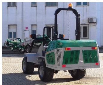
MM19/60: 2250 kg con testata M2 (ruote 23x10,50-12)

Ομπρέλα IN 16/5 με γρήγορη απελευθέρωση, 500cm διάμετρο, με φλάντζα και υδραυλικό σύστημα. Ομπρέλα IN 20/5 με γρήγορη απελευθέρωση, διάμετρο 500 cm, σύστημα φλάντζας και υδραυλικό σύστημα. Ράβδοι επέκτασης ομπρέλας, με ύψος για 1 m / 2 m.